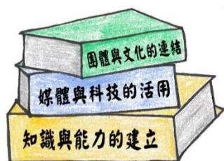
圖 4 通識音樂教育「三層核心素養」