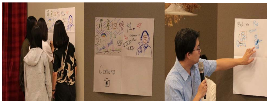
圖 8 繪畫敘事力

敘述性的故事可以透過話語來分享，除此之外亦可藉由繪畫的方式來表達對於音樂的看法，我會讓每一組的組員們討論彼此的想法再進行繪畫，組員們將分享的故事畫面描繪至海報紙上，全班的同學也藉由走動教室的方式來觀摩同學們的圖畫，藉由交流觀賞更能激發同學們的想像力。（參見圖 8）