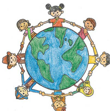
圖 6 核心素養三「團體與文化的連結」

音樂通識課程並不是要訓練學生成為一位音樂家，而是讓學生能夠達到追求「全人」的境界，透過音樂課程能讓學生們除了探求自我的身心靈平衡之外，再往外擴展到個人與群體之間的平衡，因此第三個核心素養為「團體與文化的連結」（參見圖 6）。