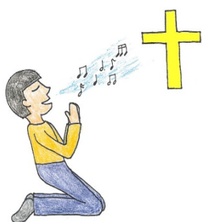
圖 2 「宗教音樂賞析」(Sacred Music)

跨類別的課程，如「宗教音樂賞析」(Sacred Music) (參見圖 2) 便是跨領域至「天類」的課程。