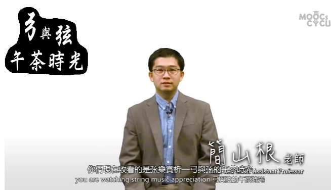
圖 5 磨課師課程「弓與弦的午茶時光」

因此，以我的例子而言，將傳統授課的精華內容整併錄製成線上課程，透過面對面授課課程加入這些線上媒材，不但能激發學生們的多元學習，更能達到音樂核心素養的第二個元素「媒體與科技的活用」。