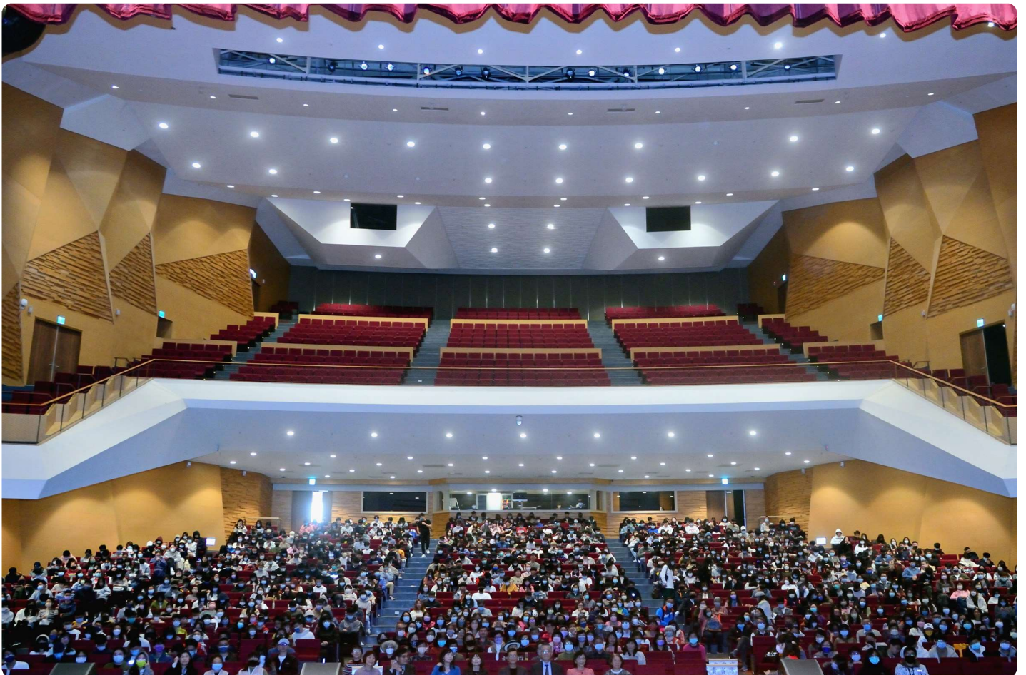
作家吳若權在中央大學大禮堂週會演講，吸引滿場的聽眾。